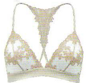
Fleur of England