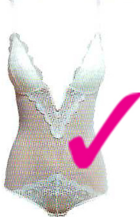
Dama de Copas